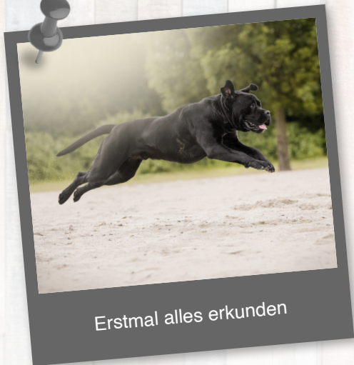
Erstmal alles erkunden