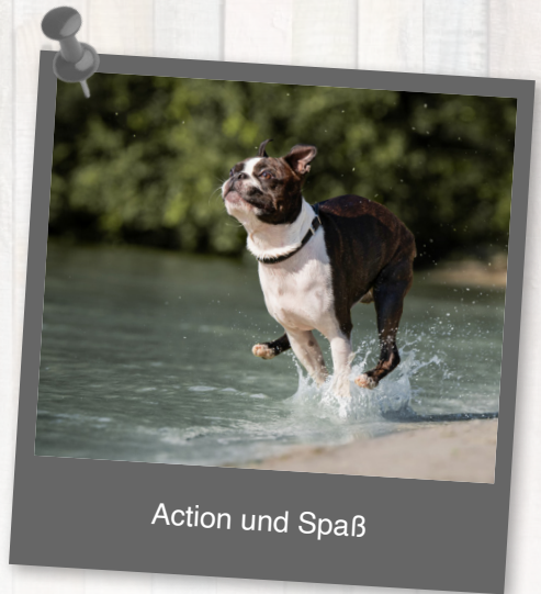
Action und Spaß