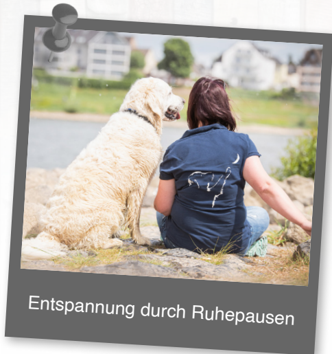
Entspannung durch Ruhepausen